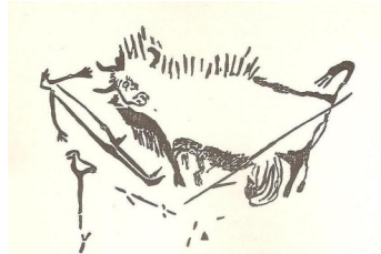
Abb. 6. Der Strichmann von Lascaux

recht auf dem Boden, sondern in einem Winkel von 37 Grad zur Horizontalen. Nachdrücklich stempelt ihn die Darstellung als Schamanen: Er trägt eine Vogelmaske, und neben ihm steckt ein mit einem Vogel geziertes Stab in der Erde. Nun gibt es eine wichtige ägyptische Gottheit, den die Überlieferung ebenfalls mit schamanischen Zügen ausgestattet hat. Er wird nämlich von seinem Zwillingbruder Seth zerstükkelt. Die in der Trance erlebte Zerstükkelung ist in Sibirien z. B. ein wichtiges, zur Initiation gehörendes Erlebnis. Allerdings wird Seth nicht wie der sibirische Schamane von den Geistern wieder zusammengesetzt, d. h. geheilt, sondern von seiner Mutter und seinen Schwestern, und danach steigt er zu den Göttern in den Himmel auf. Das Motiv des auferstehenden Osiris wird oft in der ägyptischen Kunst dargestellt. Unsere Abbildung (Abb. 7) stammt aus dem Ende des dritten Jahrtausends v. u. Z. Osiris tritt seine Himmelsreise ebenfalls von einer Schräge von 37 Grad an, genau wie der Mann von Lascaux. Auch Osiris hat ein erigiertes Glied. In der mir zur Verfügung stehenden und 1911 veröffent-